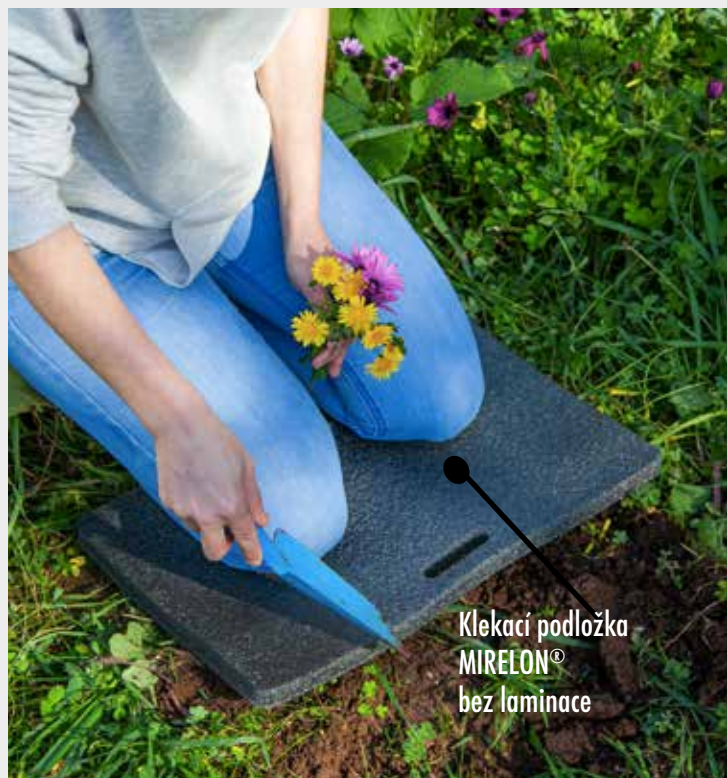
Klekací podložka MIRELON® bez laminace