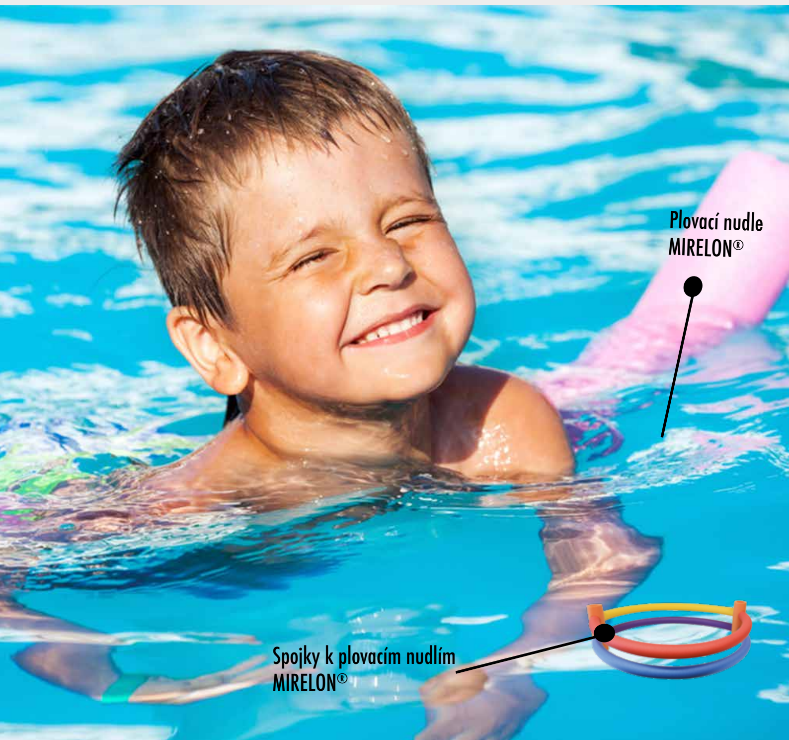
Plovací nudle MIRELON®