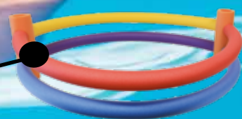
Spojky k plovacím nudlím MIRELON®