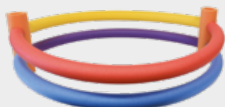
Spojky k plovacím nudlím MIRELON®