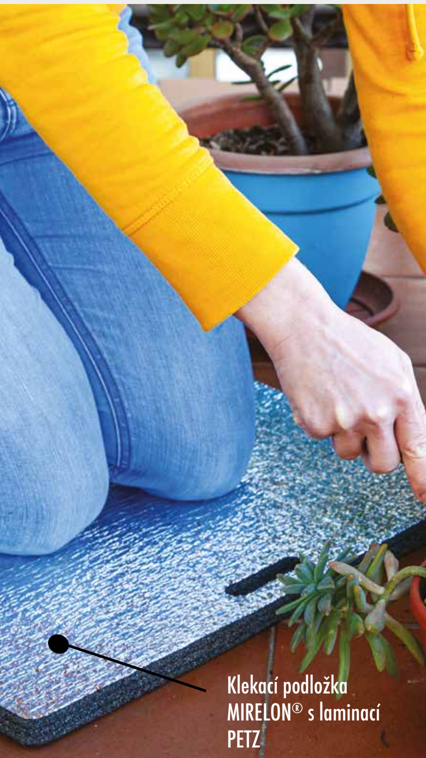
Klekací podložka MIRELON® s laminací PETZ