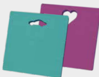
Dětská sedátka MIRELON®