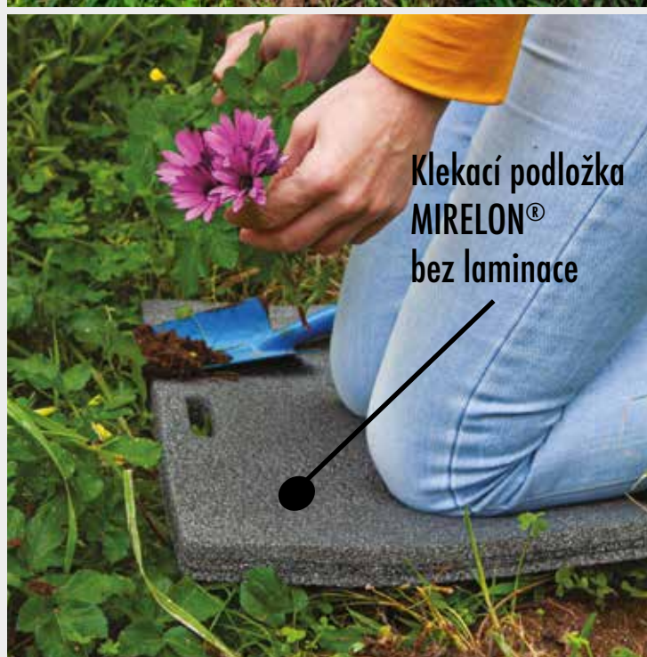
Klekací podložka MIRELON® bez laminace