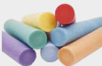
Plovací nudle MIRELON®